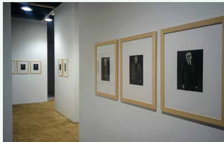
Scénographie de l'exposition « Le chemin des hommes »

Leurs regards singuliers témoignent de la complexité d'un monde rural qui ne cesse d'évoluer depuis le milieu du 19 e siècle.