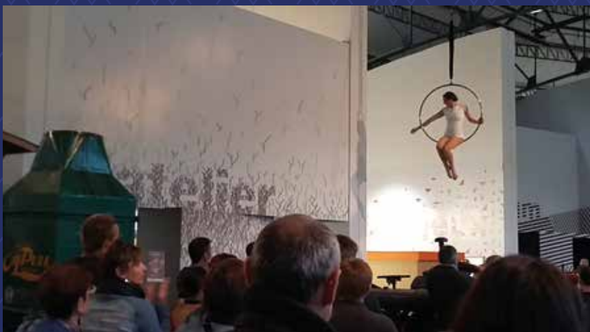
Nuit des musées - 2017

Pour ce rendez-vous convivial, chacun apporte son repas et participe à un grand pique-nique !