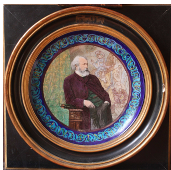
© Musée d'art et d'histoire de la ville de Meudon