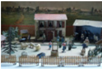
Ferme « CBG », personnages et animaux France, vers 1920, collection Burckhardt Musée Le Compa, Chartres