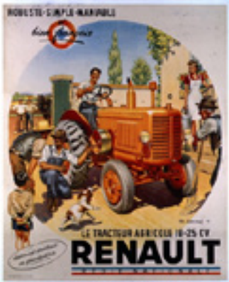
Affiche publicitaire pour le tracteur Renault Entre 1947 et 1948 Musée Le Compa, Chartres