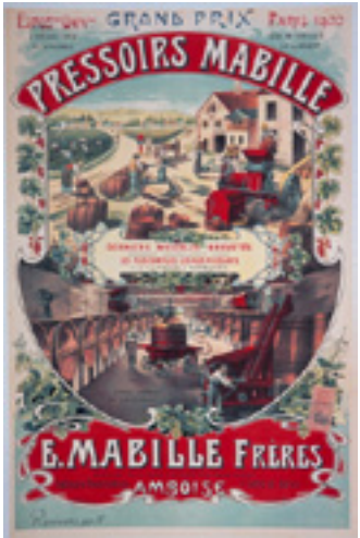
Affiche publicitaire pour les pressoirs Mabille Entre 1900 et 1920 Musée Le Compa, Chartres