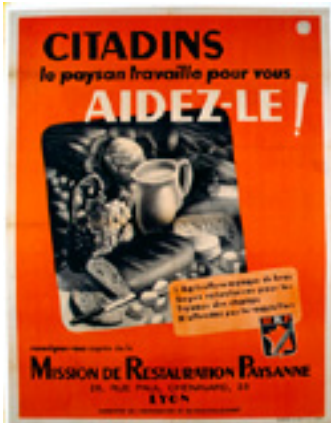
Affiche pédagogique du Ministère de l'Agriculture et du Ravitaillement pour encourager les volontaires aux travaux des champs à se présenter à la mission de restauration paysanne du Ministère de l'Agriculture de Lyon Entre 1940 et 1944 Musée Le Compa, Chartres

Et puis ceux qui militent pour l'emploi local, la production locale et l'autosuffisance alimentaire, les fermes pédagogiques et la vocation agricole