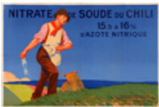
Affiche publicitaire pour le nitrate de soude du Chili Vers 1935 Collection Musée Le Compa, Chartres