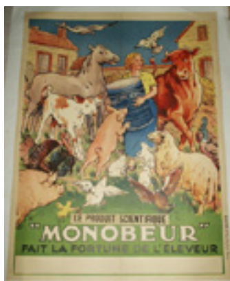
Affiche publicitaire pour le produit « Monobeur » Années 1950 Musée Le Compa, Chartres

Affiche publicitaire pour les machines agricoles et industrielles Merlin & Cie, entre 1920 et 1930, Musée Le Compa, Chartres