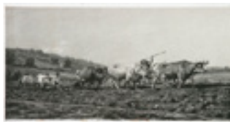
Labourage nivernais, le sombrage Lithographie 1853 Musée Le Compa, Chartres