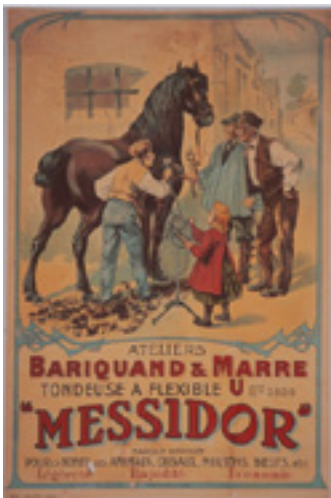
Affiche publicitaire pour la tondeuse à flexible Messidor des ateliers Bariquand & Marré Début 20 ème siècle Musée Le Compa, Chartres