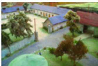
Maquette de la ferme de Beauce en 1970 Musée Le Compa, Chartres