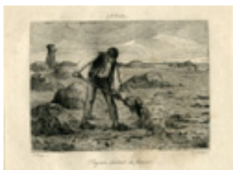
Paysan étalant du fumier Eau forte 1854-1855 Musée Le Compa, Chartres

Figure emblématique de la société française, le paysan paraît familier à tous. Chacun pense le connaître et nombreux sont ceux dont les aïeux œuvraient, il n'y a pas si longtemps, au travail de la terre. Cette proximité apparente ancrée depuis des siècles masque une partie des bouleversements subits depuis le début du 20 ème siècle. Les pratiques culturelles ont changé. Les hommes et les sociétés rurales en ont été profondément affectés.