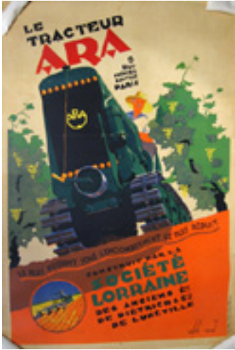
Affiche publicitaire pour le tracteur Ara Vers 1950 Musée Le Compa, Chartres