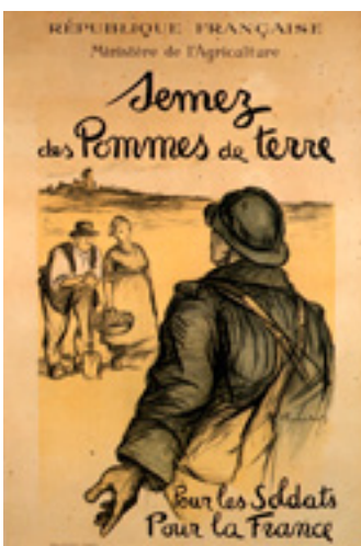
Affiche du Ministère de l'Agriculture invitant à cultiver les pommes de terre Vers 1915 Musée Le Compa, Chartres

qu'il faut susciter auprès des citoyens, qui érigent le paysan « en jardinier bienveillant », qui évoquent les services environnementaux, touristiques, paysagers rendus à la population, « le sentiment d'utilité sociale des agriculteurs ».