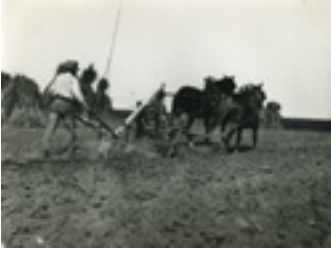
Laboureur Photographie Vers 1900