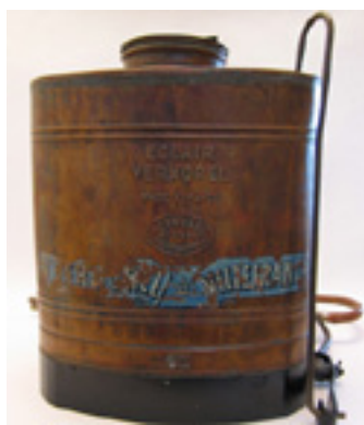
Pulvérisateur à dos Vermorel Rhône, entre 1900 et 1925 Musée Le Compa, Chartres

Objet devenu mythique pour la civilisation urbaine oublieuse des réalités rurales, la ferme, après des décennies de désaffection ou d'abandon, mérite d'être examinée. Elle est, en effet, par bien des aspects, un marqueur de l'évolution du monde rural.