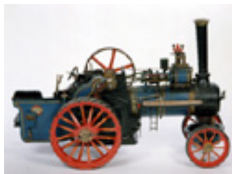
Tracteur à vapeur Allchin, Vers 1890, collection Sédima Musée Le Compa, Chartres