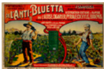
Affiche publicitaire pour l'Anti-bluetta, pesticide Début du 20 ème siècle Collection Musée Le Compa, Chartres

Après « un immobilisme agraire et multiséculaire », la France a connu - à partir de 1870 - un long siècle de révolutions agricoles. Les bouleversements ont touché le métier même de paysan : mécanisation, chimisation, irrigation, progrès de la génétique, développement des coopératives et des entreprises de travaux, concentration des exploitations, spécialisation ou diversification des productions, préoccupations environnementales, etc.