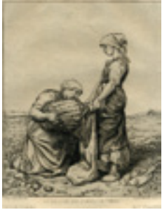
La récolte des pommes de terre Eau forte 2 nde moitié du 19 ème siècle Musée Le Compa, Chartres