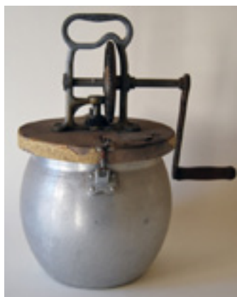
Baratte Côtes d'Armor, 19 ème siècle Musée Le Compa, Chartres