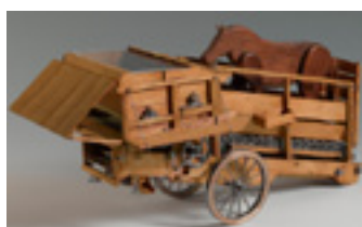
Trépigieuse, modèle 1860, Georges Champeau 1995, Maquette à l'échelle 1/10 e Musée Le Compa, Chartres