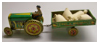
Tracteur et remorque de Mettoy, jouet mécanique, Grande-Bretagne, vers 1950, collection Burckhardt Musée Le Compa, Chartres