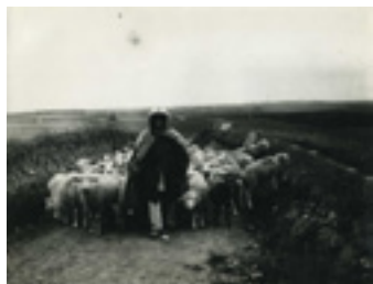
Berger et troupeau de moutons Photographie Vers 1900