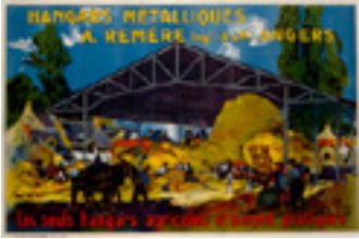
Affiche pour les hangars métalliques A. Remère, Angers 1924