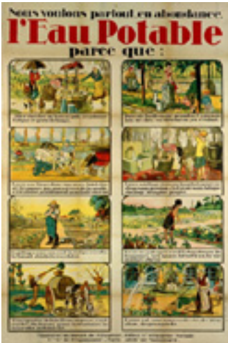
Affiche pédagogique du Ministère du Travail et de l'Hygiène sur l'intérêt de l'eau potable Vers 1925