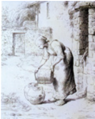
Laitière versant de l'eau dans une canne, Jean-François Millet Musée d'art Thomas-Henry, Cherbourg-Octeville.