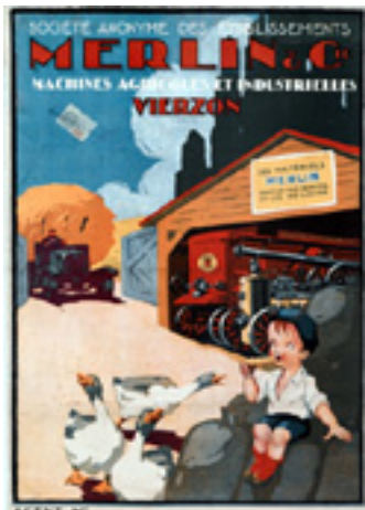
Affiche publicitaire pour les machines agricoles et industrielles Merlin & Cie Entre 1920 et 1930 Musée Le Compa, Chartres

Mécanisation et motorisation sont à l'ordre du jour, encouragées par la croissance industrielle, de nouvelles disponibilités financières (notamment les prêts du Crédit Agricole) et les possibilités d'usage collectif du matériel agricole (les CUMA).