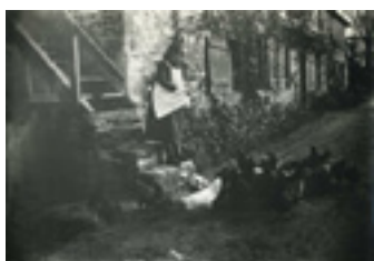
Enfant nourrissant les poules dans une basse-cour Photographie vers 1900