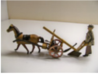
Paysan à la charrue Fernand Martin, collection Burckhardt France, 1 ère moitié du 20 ème siècle Musée Le Compa, Chartres