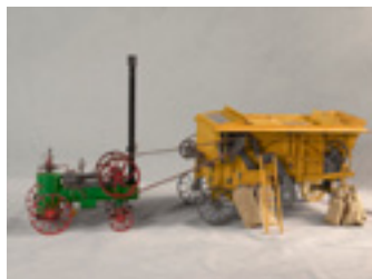
Locomobile et batteuse, Georges Champeau 1995, Maquettes à l'échelle 1/10 e Musée Le Compa, Chartres