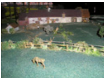
Maquette de la ferme du Perche en 1870 Musée Le Compa, Chartres