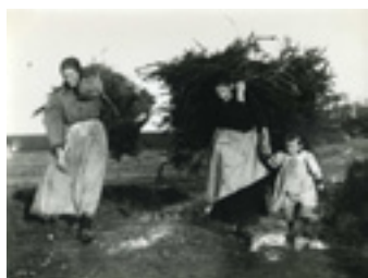
Femmes avec fagots Photographie Vers 1900 Musée Le Compa, Chartres