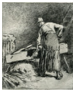
Femme qui broie du lin Eau forte 2 nd e moitié du 19 ème siècle Musée Le Compa, Chartres