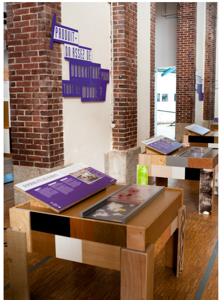
Pourquoi tout le monde n'a pas à manger ? @ Nicolas Franchot