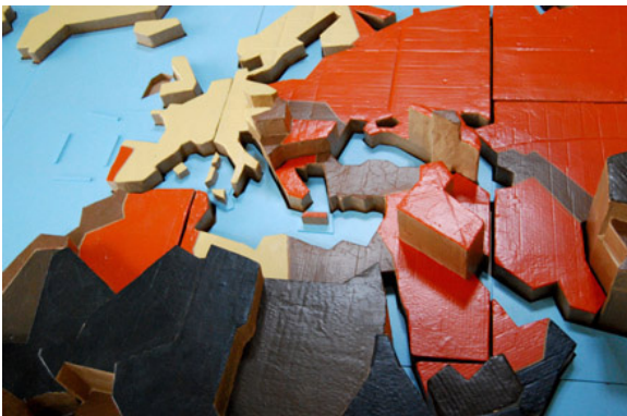
La géographie de la faim @ Nicolas Bernard