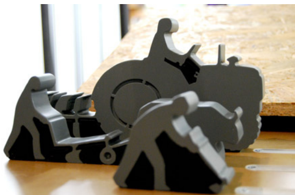
La mécanisation du labour