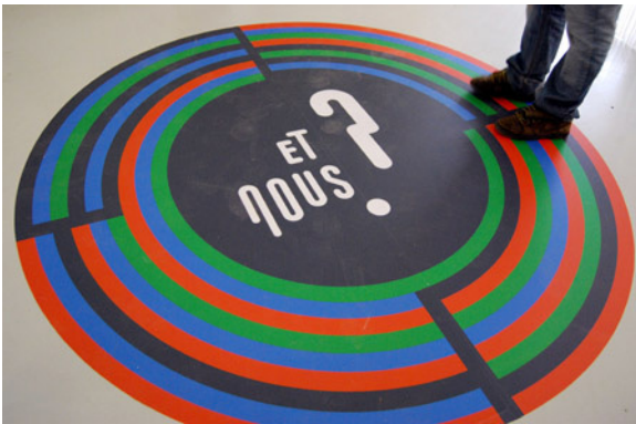
Le jeu interactif collectif @ Nicolas Bernard