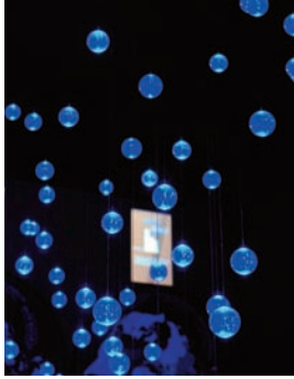
La pluie de perles d'eau