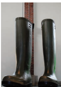
Lilian Bourgeat - Les bottes de 7 lieues