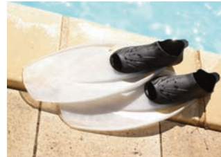
Amandine - Arrête de palmer, tu es sur la berge