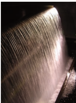
Vanessa - A la vôtre ! Brasserie Guinness - Dublin