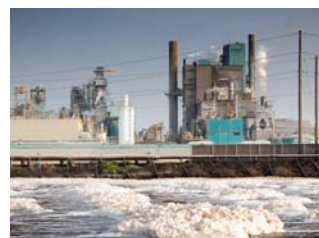
Scott Butner - Industrial Water Treatment Plant