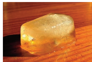
Cathy - Iceberg miniature